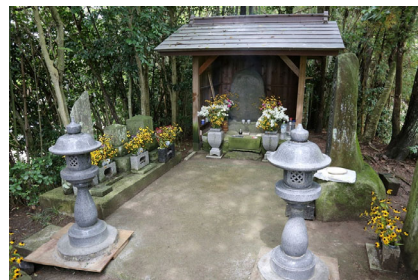
学習会（涌谷）H30. 9. 2