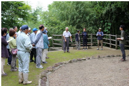
学習会（涌谷）H30. 9. 2