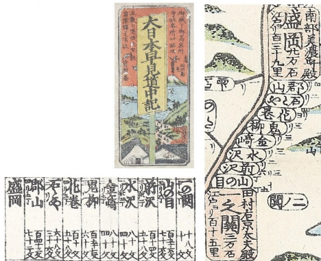
図1 「大日本早見道中記」江戸時代(幕末力) 個人蔵

(表紙) 「慶応二年 鬼柳駅処仕成井 駅処二拘り書上帳 寅六月」 一、御支配所鬼柳町之義ハ、元ハ下鬼柳村之内ニ御座候処、寛永七年 場ニ被仰付、御往来夫伝馬之義ハ下鬼柳村江被仰付相勤罷在申候、右 下鬼柳村千五百石、北鬼柳村ニて三百石、都合千八百石御伝馬高二被 成下夫伝馬差出継立罷在申候、 (中略) 一、和賀川出水ニて馬船通用相成不申候節の下り御荷物、金ヶ崎行同様 黒沢尻迄荷物背負賦り申候、御駕籠御長持并外臈物賃銭払ハ花巻迄継 立申候、黒沢尻御泊り之節ハ黒沢尻迄参、翌日ハ黒沢尻より人足継 立申候、 (後略)