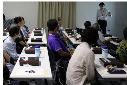
学習会（フォーラム前）H30. 8. 26