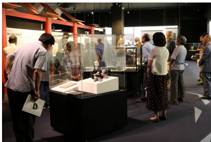
学習会（展示風景）H30. 8. 26