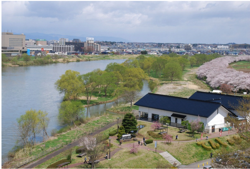
陣ヶ丘（北上市立花）から北上川を望む