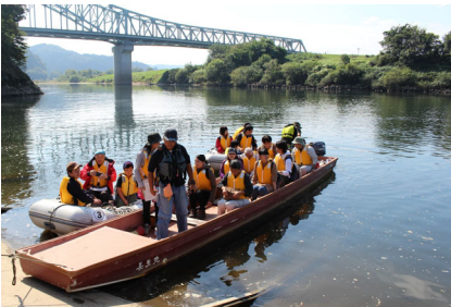
学習会（航路体験）R1. 9. 29