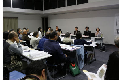
学習会（フォーラム）R1. 10. 19