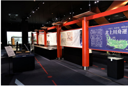
展示風景 R1. 9. 21～12. 8