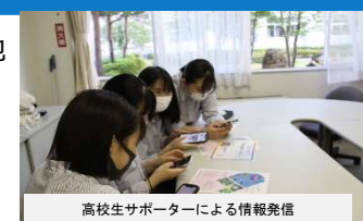
高校生サポーターによる情報発信

アンブレラスカイ、ひまわりプロジェクトなどは「地域おこし」事業として位置づけている。今後は「地域づくり」の事業として、地域の皆さんと共に生活に役立つ講座や事業について、これまで以上に取り組んでいきたいと考えている。また、インターネットやSNSの活用は、運営に欠かせないツールになると感じている。参加していただく住民の姿を想像し、各世代にマッチした方法で住民のデジタル活用を促進していきたい。