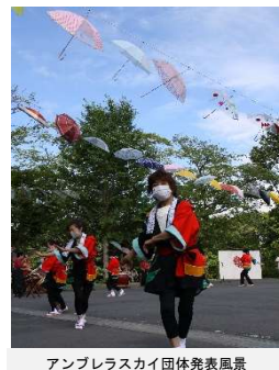
アンブレラスカイ団体発表風景

毎年参加していただいている利用者が多いが、開催の時間帯を変えることで、講座に興味を持って参加していただいた新規参加者が増えてきている。