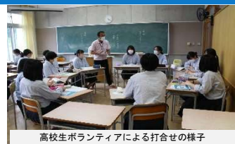
高校生ボランティアによる打合せの様子

千厩地区住民が自ら地域の将来像を考え、誰もが地域への愛着をもち、安心して暮らせる住みよい地域社会を実現していきたいと考えている。千厩地区地域づくり計画の目的である、「健康で笑顔あふれる地域を次世代へ」をテーマに、この地域に住む人々がいきいきと心豊かに生活するため、地域住民自らが話し合いを实践し、地域に対する誇りと自信をもって魅力あるまちづくりを推進し、住民自治の拡充のため事業を運営していきたい。