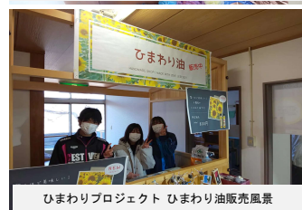
ひまわりプロジェクト ひまわり油販売風景