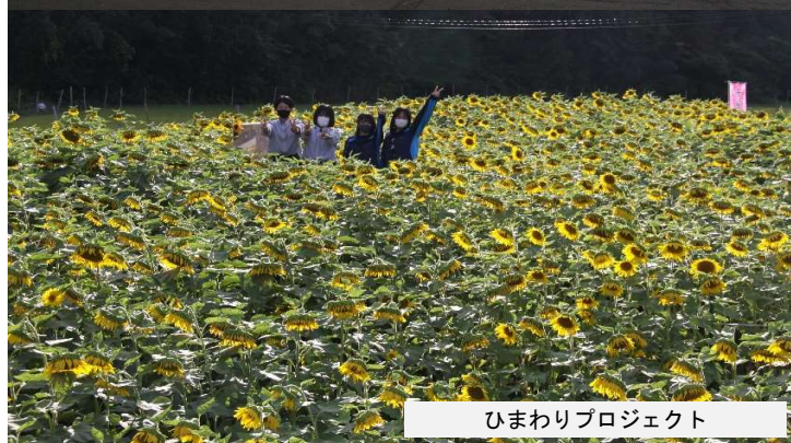
ひまわりプロジェクト