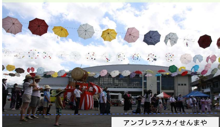
アンブレラスカイせんまや