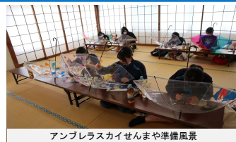
アンブレラスカイせんまや準備風景

ホームページのメインページには、YouTube「せんまやチャンネル」をはじめ、Instagram、高校生がボランティア活動の様子を発信する「千厩みんなのブログ」などを活用し、タイムリーな話題を積極的に情報発信している。