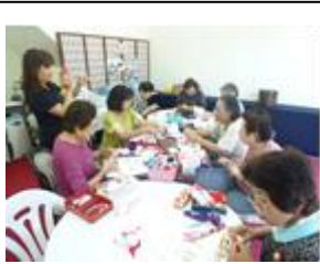
つるし飾りのパーツづくりの風景

【つるし飾り展】・毎月作製したつるし飾りのパーツを完成させ、展示する。(18日間 入場無料)