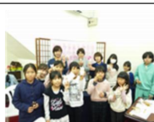
羊毛フェルトの風景