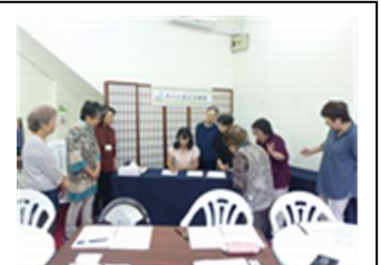
美文字教室の風景