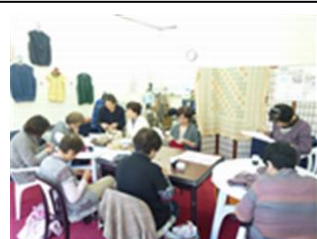
みんなで編もう♪の風景