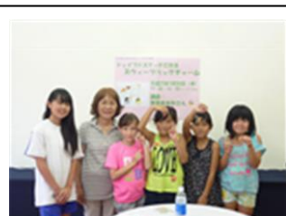
スウィーツバッグチャームの風景