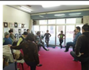
オステオパシー体操の風景