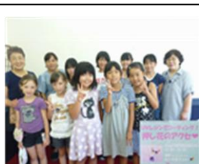
押し花アクセの風景