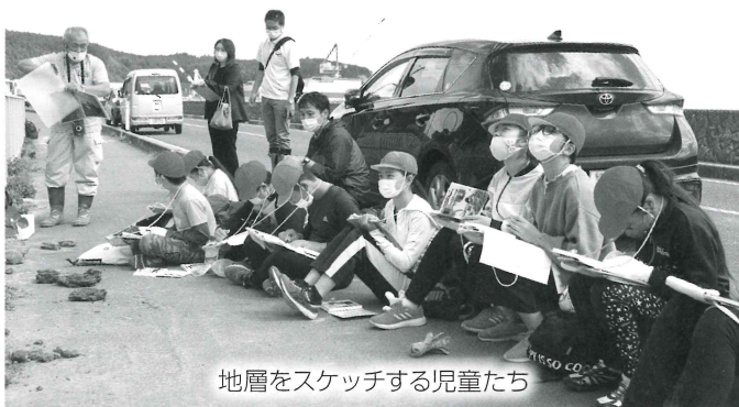
地層をスケッチする児童たち