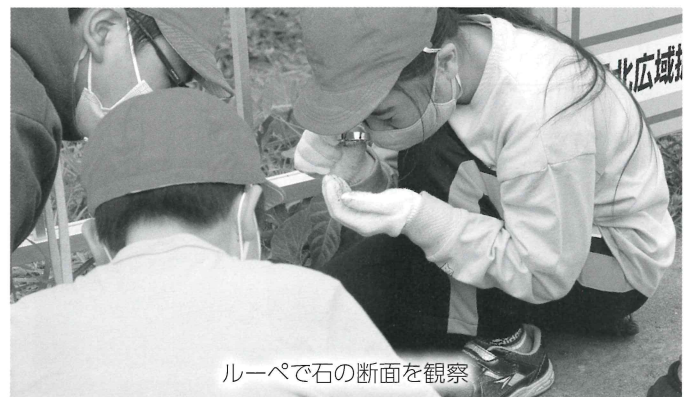
ルーペで石の断面を観察