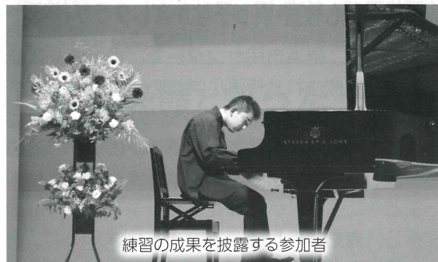
練習の成果を披露する参加者

10月3日、アンバーホール大ホールで、第24回ピアノマラソンコンサートが開かれ、市内のピアノ愛好家ら59人が、次々にさまざまな曲を披露しました。