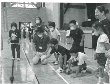
同じチームのメンバーから応援を受けながら、狙いを定めボールを投げる児童

放課後子ども教室は、各市民センターを拠点に、季節の行事などを行っています。市内の小学生なら誰でも参加できますので、詳しくは、学校を通して配布されるチラシをご覧ください。