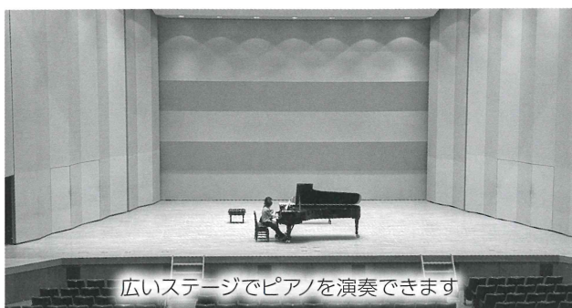
広いステージでピアノを演奏できます

約1週間後に控えているピアノマラソンコンサートと同じステージで練習できることもあり、多くの方が熱のこもった練習をしていました。