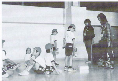
ボランティア支援のようす （小学校の体力測定の補助）

皆さんもぜひ応募を！（申し込みはP4の申込書で） 特におじいさん、おばあさん、知恵と経験を子どもたちに伝えていただけませんか？