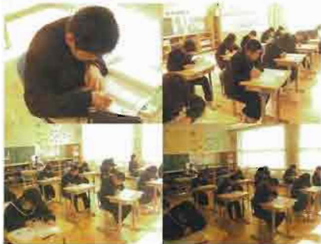
英語のテストにお邪魔しました。みんな真剣です。