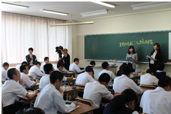
図2 盛岡市提供による地域人材を最大限活用した地方創生に関するミニ講座