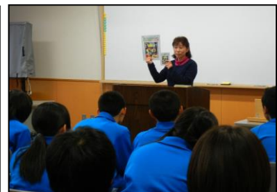
【「いわ100」を活用したブックトークの様子】