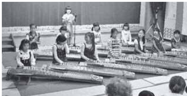
市民センターまつりで箏の発表

この日は当番の指導員のほかにも、何人かの指導員に協力をいただき大盛会となりました。