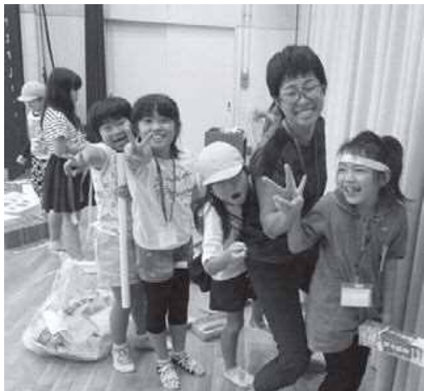
作って遊んで仲良くなります

中里で育ったことを誇りに感じられるよう、これからも子どもたちの自主性を尊重した遊びや体験のできる居場所をつくり育んでいきます。また、地域・学校・PTAなどの連携をさらに推進し、心豊かにたくましく生きていく力を育んでいきます。