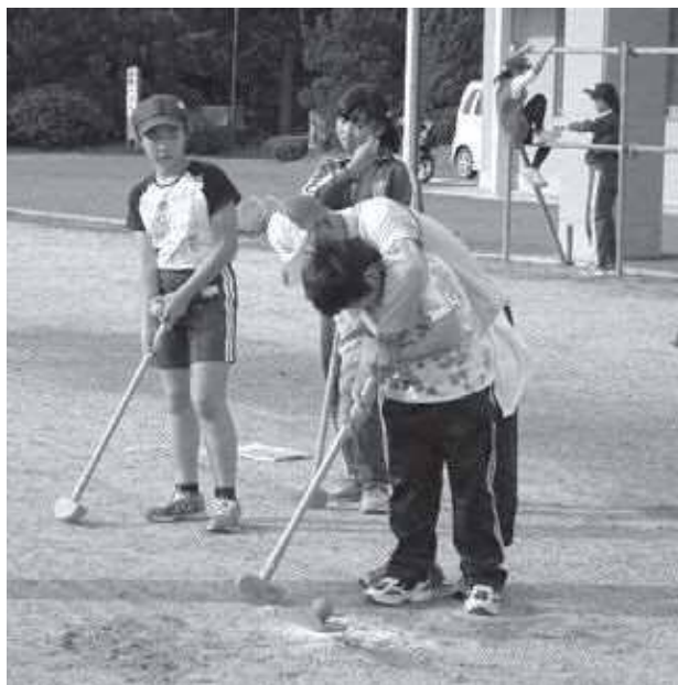
世代間交流事業（グラウンドゴルフ大会）

世代間交流事業では、「スポーツ以外のことで何か楽しく学習できることはないか？」との視点から、永井地域コミュニティ活性化協議会の生活環境部会の協力のもと、「地域の食文化を学ぼう」をテーマに、高齢者の方々と一緒に郷土料理である「はっと」を食べながら昔の話をたくさん聞くことができました。はっとを食べた後は「グラウンドゴルフ大会」を開催しました。初めは緊張気味だった子どもたちも、おじいさん、おばあさんのスーパープレイに大興奮でした。手とり足とり指南を受けているうちに、すっかり打ち解けて笑顔で仲良くプレーを楽しんでいました。