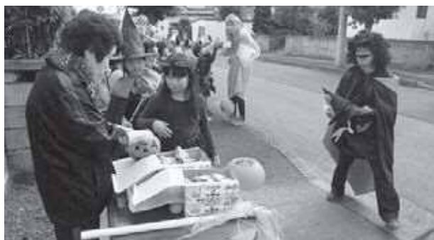
子どもも大人も仮装して楽しめます

学校の振替休日や長期休業期間には沢登りや中里探検、ホテルの観察会、餅つきなど季節に合わせた特別プログラムを行っています。今年のハロウィンパーティーでは、子どもたちも全員仮装をして中里地域に繰り出しました。元気に地域を巡る子どもたちを地域の方々も温かく迎え入れ、お菓子をあげたり一緒に公園で遊んでふれ合うことができたことは、地域にも子どもたちにも大きな財産になりました。これからも地域の魅力を生かしながら子どもたちの成長を温かく支えていきます。