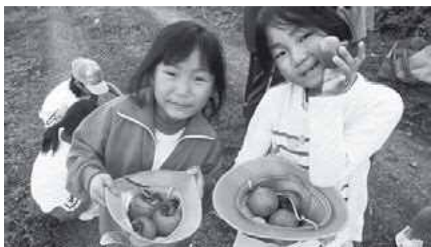
たくさん柿をとったよ!

時折、約束を守らなかったり、喧嘩をしたりもしますが、その都度指導員とひとつひとつ問題を解決していきます。