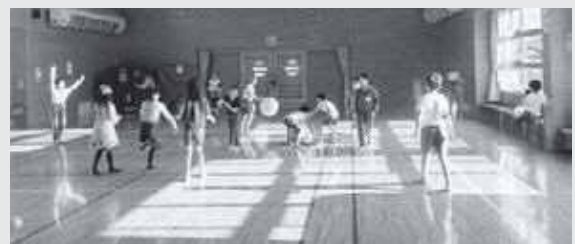
こっちにボールくれ「チャレンジタイム」

チャレンジタイムでは、子どもたちと一緒に鬼ごっこやバドミントンをして遊んでいます。一つの事に集中し、上達するまで続ける子どもたちの姿にいつも感心しています。これからも子どもたちが伸び伸びと遊べるように心がけて活動していきたいと思います。