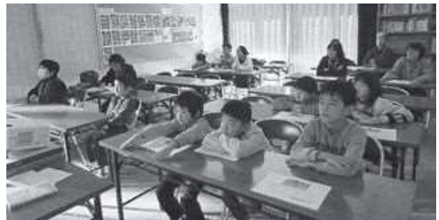
冬休み中、アニメDVD鑑賞は意外と真剣に見ていました