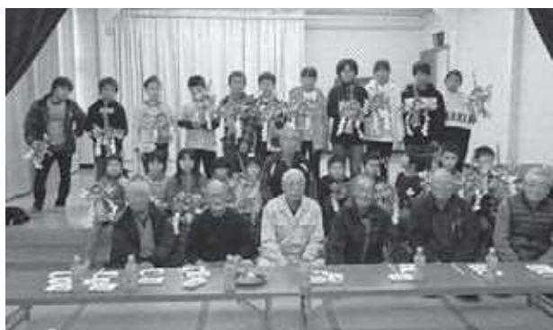
しめ縄飾り 完成 上手にできました!!

夏休み期間中は、例年体験学習を兼ねた遠足を行っています。地域行事との日程調整のため開催できず親子レクリエーションとなりました。コミュニケーションが十分に取れました。冬には、毎年恒例のしめ縄飾りを老人クラブの皆さんの指導をいただきながら作り上げました。子どもたちが作ったしめ縄飾りでお正月を迎えます。作り終えた後はこま回しをしました。手作りのこまは大人気で夢中になって回していました。杵と臼で餅をつきご馳走になりました。