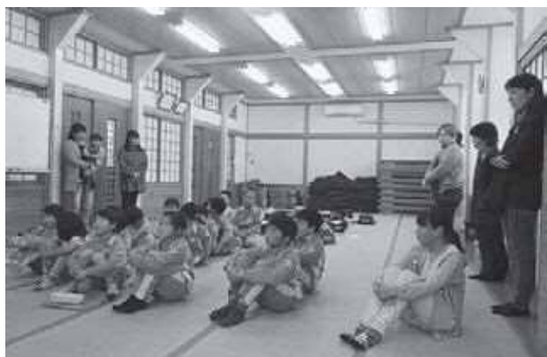
じきょうっ子広場 初日 所長の話を聞いている姿

最初に子どもたちは和室で宿題をし、子ども同士で教え合いながら、時々指導員に助言してもらっています。勉強が終わると体育館や屋外に移動して、卓球やバドミントン、サッカー、丸太渡り、鬼ごっこなどで子どもたちがルールを決めて遊びます。学年・男女関係なく仲良く、暑さ・寒さに負けず遊んでいます。