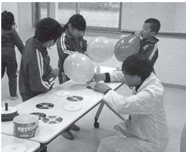
おもしろ理科の実験体験活動

子ども教室での活動は、学校との連携により学校の教育目標に沿って展開していきたいと思えます。学校統合を控えた今、本事業は子どもたちの居場所・遊び場を確保するだけでなく、地域の方々と子どもたちを繋ぐ役割を果たすことを念頭に置きながら、子どもたちの笑顔が少しでも増えるような活動を継続していきたいと思えます。