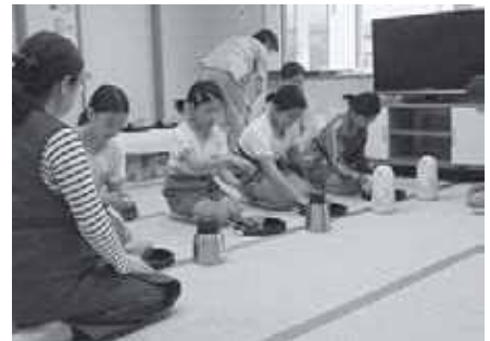
そうそう、そうですよ「茶の湯教室」

11月初旬に『一関学習交流館まつり』を開催していますが、「茶の湯教室」の成果発表を兼ね、当教室の子どもたちが、一般のお客様にお茶の接待を行います。子どもがお茶を点て、お客様へお茶をさしあげます。子どもたちからお客様への「おもてなし」の晴れ舞台となります。また、「チャレンジタイム」と称する『遊びの教室』では、子どもたちの自主性に委ね、思う存分スポーツやボール遊びを満喫させています。小学1年から中学3年まで全く異なる学年の活動となりますが、子どもたちはお互い戸惑い、遠慮しながらトラブルもなく活動しています。指導員の皆様には、子どもたちを見守りつつ、そして時には厳しく指導していただき大変感謝しております。