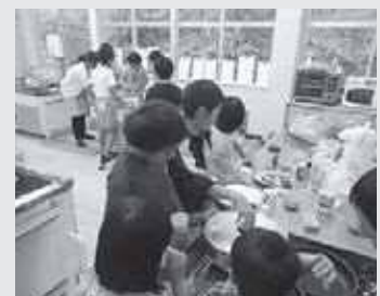
ハロウィンのポップコーン作り

大人も子どももイライラする人が増えているように感じるこの頃、辛い思いをせず成長していく手助けになれるよう、心がけています。