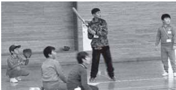
高学年生が参加すると、遊びの充実さが増します

体育館使用ができない場合、校庭となりますが、何かから解放されたかのように、一斉に自由でのびのび遊び回っています。