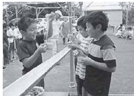
「おいしー!」「楽しいー!」

スタッフの皆さんには畑掘りや竹加工、調理などのほか、様々な活動で早い時間から準備やお手伝いをいただいております。皆さんのご厚意に深く感謝し、今後とも地域の子どもたちの健やかな成長のためご協力をよろしくお願ひいたします。