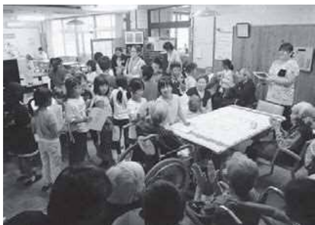
寿光荘を訪問して利用者と交流

また、子どもたちと一緒に指導員も楽しめるような笑顔のあふれる内容となるよう心掛け、地域の宝を地域全体で見守っていく活動となるよう取り組んでまいります。