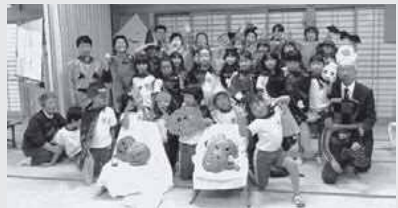
ハロウィンパーティー楽しかったよ

また、移動教室でどこかに出かけたり、畑で野菜をつくってみたりと、子どもたちと一緒に新しいことに挑戦し、スキンシップを図りながら活動していきたいです。