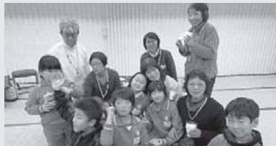
みんな仲良し「孫」のように常に温かく見守っています

「滝っこひろば」の子どもたちは、元気がよくて動きについていけないこともあり大変ですが、何年か先の姿に思いを馳せながら、温かい気持ちで接しています。あいさつができるとか、物を大切に、そして仲良くできるようにいつも願うものです。