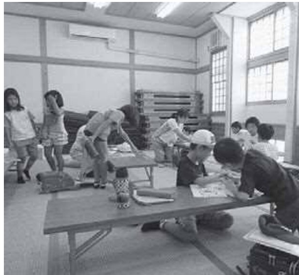
「萩 "SHOW TIME"」に飾る 夕ヌキ子君書きに夢中

教えていただいたりと世代間交流を積極的に行っています。地域一体となって伝統芸能である「鶏舞」の練習も定期的に行って継承に努めています。