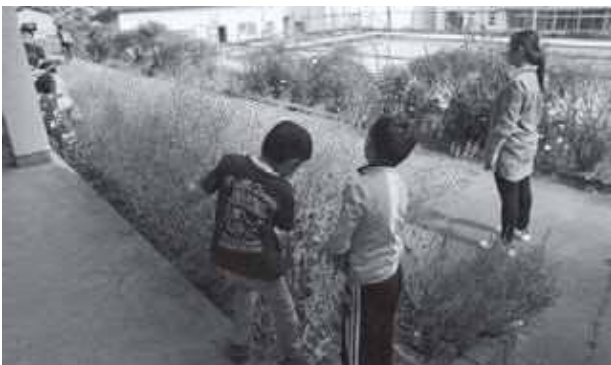
市民センター前の畑の草取り

子ども教室にくと、まずは宿題を終わらせてから、ボール遊びや追いかっこなどで汗だくになりながら体を動かしたり、静かに折り紙をしたり、トランプをしたり、様々な活動に自由に取り組んでいます。天気の良い日には、市民センターのすぐ近くにある「じじ山」（山林を畑や広場として整備した私有地）に行っで遊んだり、水路でザリガニ捕りもしました。