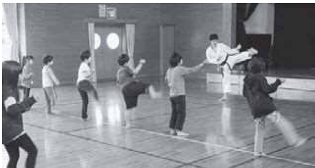
バランスが大切「空手教室」

『特別プログラム』と称し、普段あまり経験できないような野外活動や季節行事の取り組みなどをスポット的に実施しています。夏休み中に「沢のぼり体験」や「岩手県水産技術センター公開デー」に参加しての海の生き物との触れ合い、冬休み中に「門松づくり体験」や「スケート教室」などを実施しています。指導員や児童、保護者の方々から意見を聞きながら、人気の高いものは継続して実施するようにしています。多くの児童に興味をもってもらうため、新たなプログラムについて検討しています。