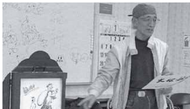
地域の達人(指導員)が得意な遊びプログラムで楽しませます

以上のように、後半の時期になってからは季節行事を取り入れた活動をしています。今後も特色のある活動を模索していきたいと考えています。