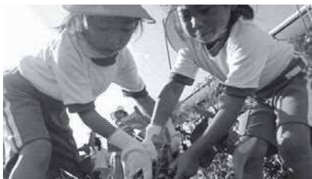
野菜を収穫する前に草取りもしなきゃ!

子どもたちは体を動かすことも大好きなので、移動教室として運動公園に行き、汗だくになりながら思いっきり走り回ったり、畑で野菜を収穫したりと元気に活動しました。