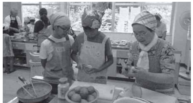
地域の方と料理体験

夏休みには、地域住民との触れ合う機会がほしいという保護者のアンケートに応える形で、市民センターの料理教室に参加している方々と一緒にじゃがいもを使った料理にも取り組みました。