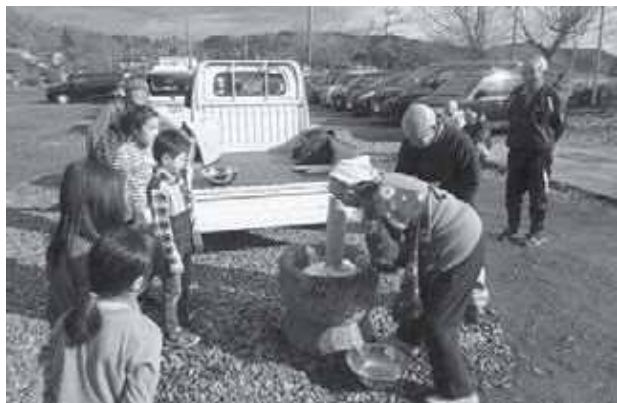
餅と白で餅つき おいしかった!!

また、地域や保護者の皆さんのご協力をいただきながら、地域との交流を深め、大人になってからも大切な思い出として、また自分たちが地域の大人になったときにもじきょうっ子と関われるよう、子どもたちの心に残る活動を継続していききたいと思います。