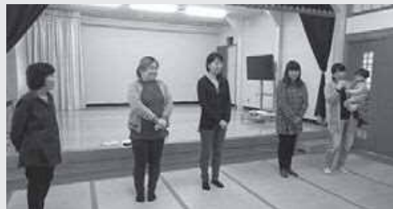
指導員とボランティアの皆さん よろしくお願ひします

真冬でも半そで・短パンの子どもがいるくらい元気な子どもたち。家庭や学校では体験できないことを楽しみに参加してくれる子どもたちを安全で安心な場所として迎えられるような活動をしていきたいと思います。