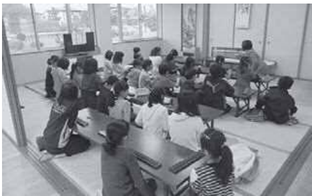
こちらを注目してください「そろばん教室」

活動場所である一関学習交流館は、赤荻小学校や放課後児童クラブ（赤荻クラブ）と隣接したところであり、活動拠点としては非常に恵まれた環境にあります。小学校、学童クラブ、PTA、地域の方々とは今後ともお互いの連携を深め、さらなる活動の充実を図っていきたく考えています。当教室の特徴である『学びの教室』は、保護者から継続を望む声が多いことから、指導員と協議しながら今後も継続するとともに、新たなプログラムについても検討していきたく考えています。