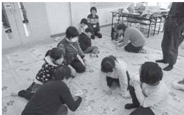
自由遊び以外の活動は、どんなプログラムが良いか難しいです

また、参加の子どもは1～3年生が多く、高学年になると参加が少なかったため、高学年が参加できるプログラムも計画します。