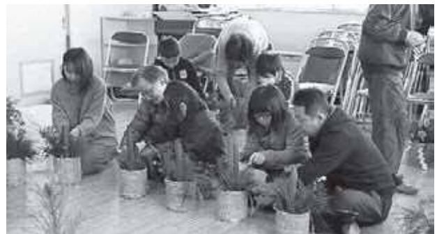
ミニ門松作りは毎年大人気です

また、まゆだま飾りでは、飾っている途中「このお餅食べられるの？」という質問があり、みんなでお餅をつまみ食いしながら、とても楽しく過ごしました。