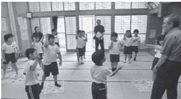
ゲームも全力！みんな元気いっぱい

市民センターに来たら“まず宿題”というお約束は定着しており、声掛けをしなくても子どもたちは自ら机に向かいます。宿題の後に活動が始まりますが、「サツマイモの苗植え～収穫」「レク」「映画会」「夏祭りポスター作り」「紙芝居」「工作」「豆まき」等、毎回来るたびに違った活動で子どもたちを楽しませています。