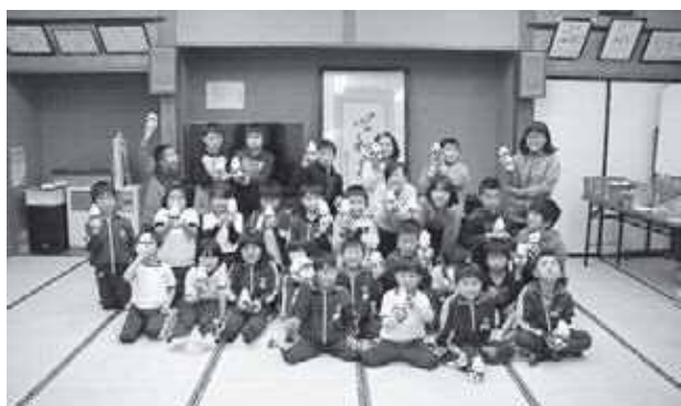
靴下を使って雪だるまを作りました

また「挨拶」や「宿題」は定着してきているので、引き続き取り組んでいきたいと思ひます。