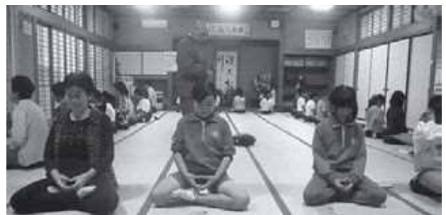
座禅をして、心を静めております

子どもたちは、地域のみなさんから支えられ、あたたかな見守りの中で、元気に成長しています。