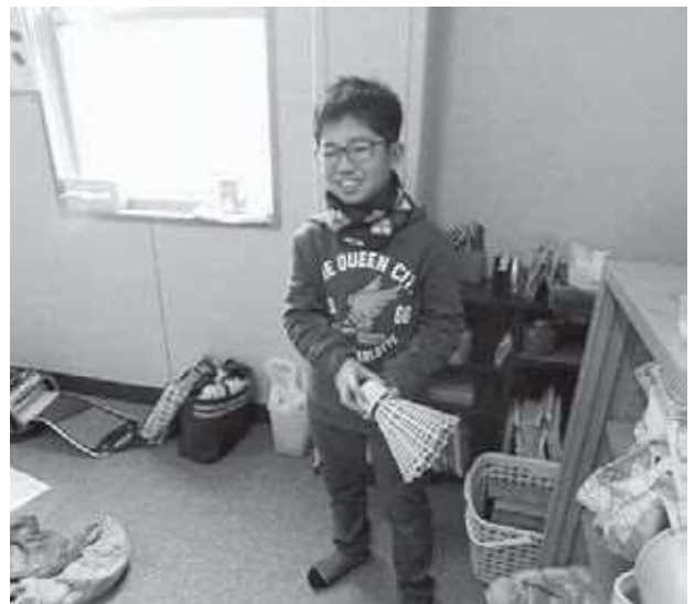
今日は何してあそぶ？

放課後子ども教室は、子どもたちの自主的な活動を応援し、見守り活動をしています。特別な活動メニューは設けていませんが、子どもたちにとっては放課後子ども教室自体が特別な空間と時間のようです。