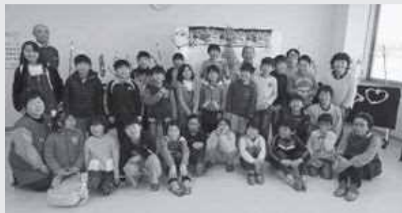
クリスマスお楽しみ会より

子どもたちの日々の成長を間近で感じることができ、感心するとともに、私自身が元気をもらい、大きな励みになっています。これからも、子どもたちの元気な姿を楽しみに指導員を続けたいと思えます。