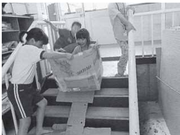
段ボールで階段を滑り落ちる

段ボールを使った工作では学年関係なくみんなで作り、できあがった作品で一緒に遊んでいます。