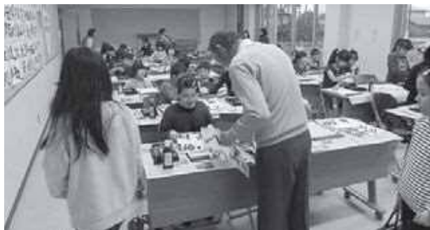
丁寧に書けてるね「習字教室」