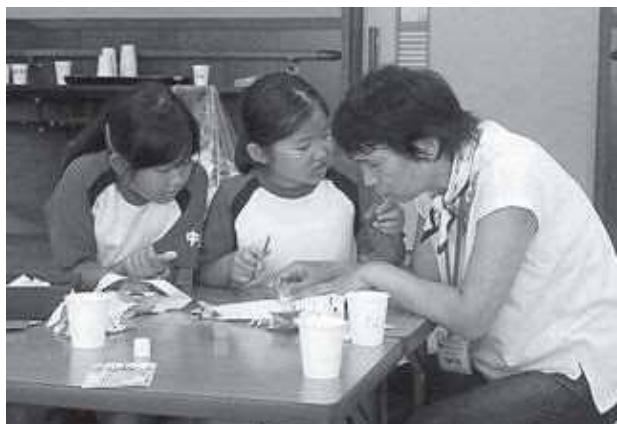
指導員さんと考えながら工作します

中里放課後子ども教室は、毎週木曜日午後3時から5時まで開催しています。初めに宿題を終えた子どもから自由に工作・卓球・バドミントンなどで元気に遊びます。廃材を使った工作は根強い人気で、子どもたちの底知れぬ創造力が発揮される場となっています。子どもたちが遊びの中で自己肯定感が育まれるよう、指導員が安全を見守りながら楽しく活動をしています。