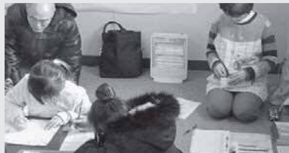
子どもたちを優しく見守ります

子ども教室は、子どもたちにとって普段の学校生活の延長にあるけれど、学校の教室とは違う空間で、自由な発想で活動できる場所と感じているようです。そんな自由な発想に応えるため、指導員も楽しみながら同じ目線で見守りをしています。