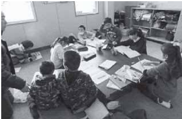
宿題は先に済ませるぞ！

子ども教室に来て早々の子どもたちは、自ら進んで宿題に取り掛かります。「宿題は先に済ませる」、これはずいぶんと定着しました。真面目に宿題に取り組み、宿題が終われば思いっきり遊びます。見守る指導員も本気で向きあい、筋肉痛になりながらバドミントンやドッジボールをしています。