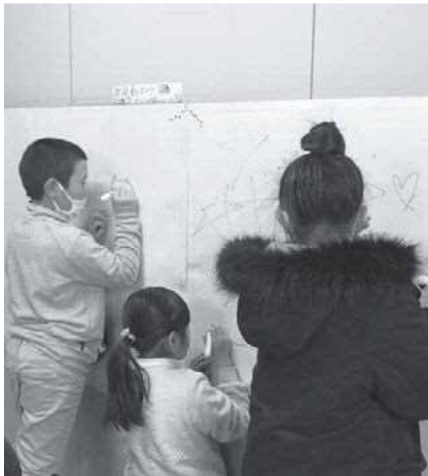
落書きは楽しいよね

子ども教室を開催している木曜日は、スポ少の練習日と重なり、遊ぶスペースが少し狭くなります。それでも、子どもたちの活動は自由な発想とチャレンジ精神でいっぱいです。指導員は経験とアイデアで、子どもたちに向きあっています。そして、今日も賑やかに開催しています。