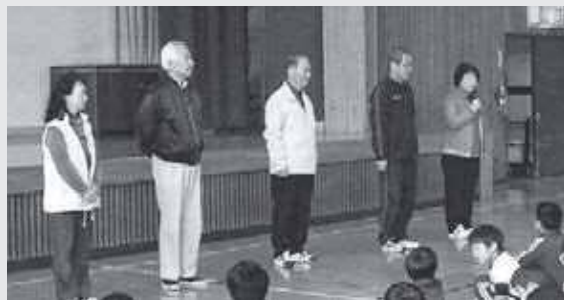
開講式で指導員さんから自己紹介

子どもたちは「こんにちは」と元気な声でやってきます。キラキラと輝く目で、伸び伸びと活発に行動しています。高・低学年との交流では、協力し楽しそうな様子で、子どもたちの笑顔が嬉しくなります。これからも見守り、支援していきたいと思ひます。