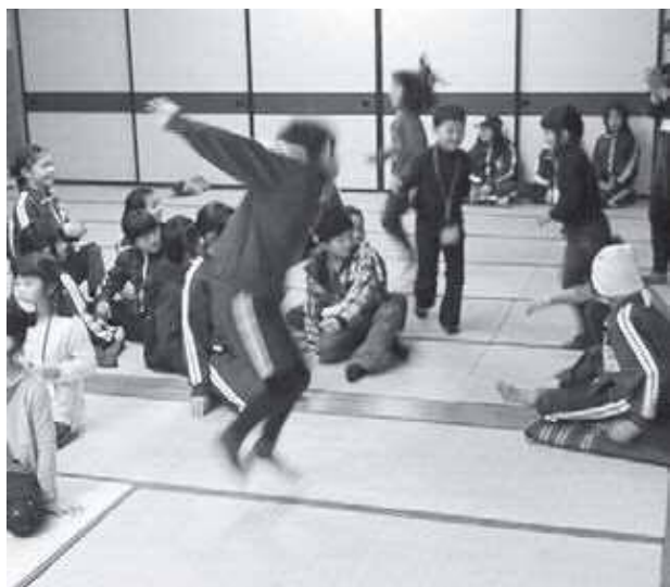
クリスマス会 座布団取りゲーム

また、あこおぎ子ども広場と合同企画を開催することにより、他校の子どもたちとの交流を図りたいと思います。