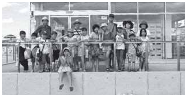
プールに着きました

冬休みは、あこおぎ子ども広場の子どもたちと一緒に千厩アイスアリーナに行きました。通う学校が違うため初めは戸惑っていましたが、すぐ打ち解けて滑っていました。