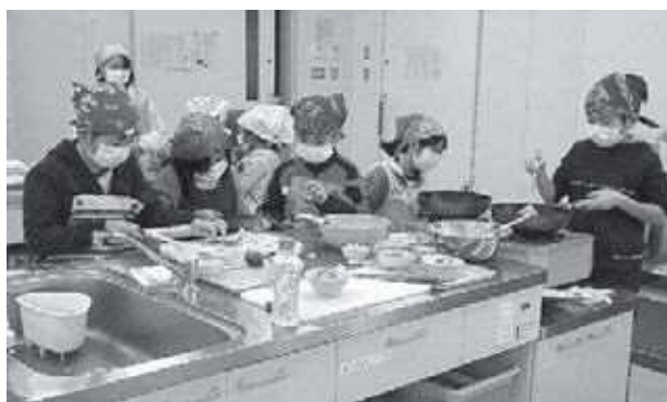
クリスマスお楽しみ会