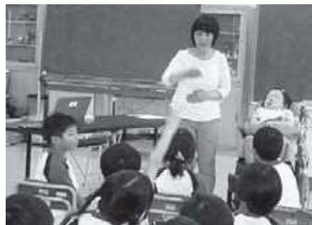
学校と連携 命の尊さを学びました

ついて知る機会を設けたらどうか」という意見を受けて、学校で1年生を対象に一歩さんと一歩さんのお母さんを講師に迎え「一歩さんと命のお話」の授業を開催しました。一歩さんと対面する子どもたちは初めのうちは緊張と不安の様子でしたが、彼女が障がいを持ちながらも温かい家族の愛情に育まれて生きている話や、彼女の呼吸や僅かに動くまぶたなどから気持ちを察し、命の尊さを学びました。最後には全員が一歩さんと握手をして手の温もりを感じ親しくなっていました。数日後、子ども教室にデビューした1年生は真っ先に一歩さんと握手をしてから活動を始めていました。中里放課後子ども教室は地域・学校ともに心が通じ連携した活動を行っています。