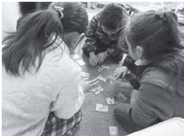
犬も歩けば… どこぞ?