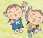
教育振興運動イメージキャラクター 教ちゃん(左)と興ちゃん(右)