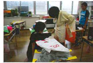
しっかり 前を合わせて

また、写真撮影ボランティアのみなさんには、子どもたちの表現豊かな発表の様子や係の仕事に取り組む真剣な表情など、たくさん記録に残していただきました。