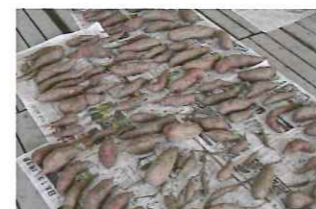
たくさん 収穫できました!

春の耕起作業からはじまり、畝立て作業やマルチかけ作業など、たくさんのボランティアの方々に畑づくりにご協力いただき、子どもたちは、楽しく実習を行うことができました。