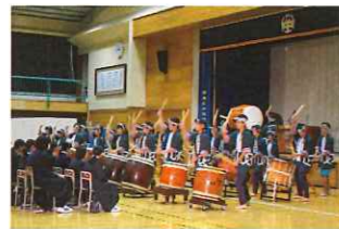
「室根中学校文化祭」

初披露は、10月27日、「室根中学校文化祭」。はじめてのステージ発表でしたが、息の合った演奏で、華やかにオープニングを飾りました。11月2日の「むろね音楽会」、10日の「むろね芸能発表会」でも、練習の成果を発揮し、見事な演奏を披露しました。