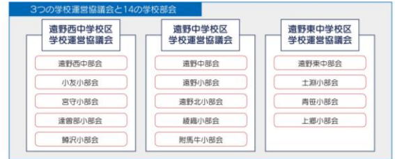
【図】遠野市の学校運営協議会は中学校区で設置。学校運営協議会の中に、「学校部会」を設置している。

令和4年4月1日、「遠野の子どもたちの生きる力を地域みんなで育み、地域とともにある学校づくりと学校を核とした地域づくり」を目指し、遠野市学校運営協議会規則が施行されました。それに合わせて、同日付で44名の学校運営協議会委員と113名の学校部会委員を任命、委嘱するとともに、3名のエリアコーディネーターを配置し、「コミュニティ・スクール」の取組が始まりました。