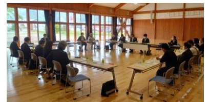
【写真】遠野中学校区学校運営協議会の様子

学校運営協議会は、3つの中学校区で順次開催されました。このうち、5月26日に開催された遠野中学校区学校運営協議会では、中学校区内の小・中学校の学校運営の基本方針の承認と学校部会で話し合われたことを共有しました。委員からは「中学校区として、具体的な取組をするために、ビジョンや目標、あるべき姿などを共有することが必要ではないか」との意見が寄せられました。今後は、寄せられた意見を踏まえ「目標やビジョンの共有」については「熟議」の実施を念頭に有効な方法を検討していくとともに、より良い制度となるよう、これまでの会議や取組を踏まえた検討などを進めていきます。