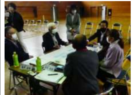
育みたい子どもの姿について語り合っている 参加者のみなさん