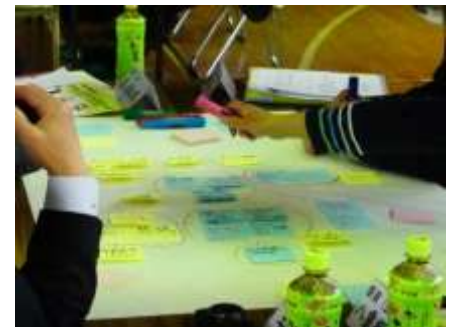
参加者のみなさんが個人で意見を付箋に書き、語り合っています。