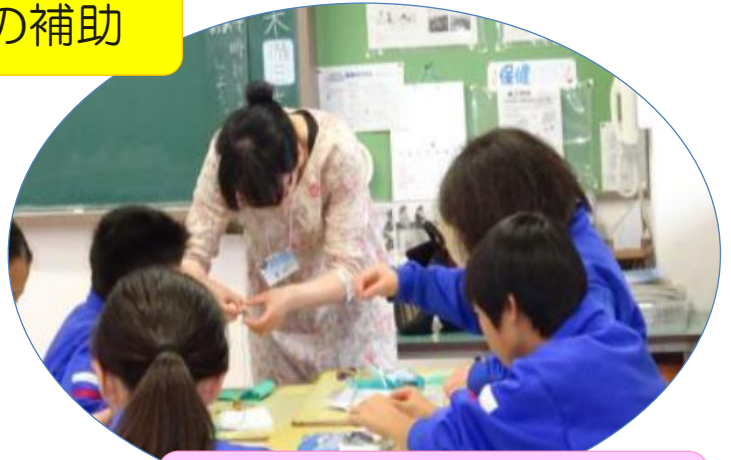
校外活動の引率補助