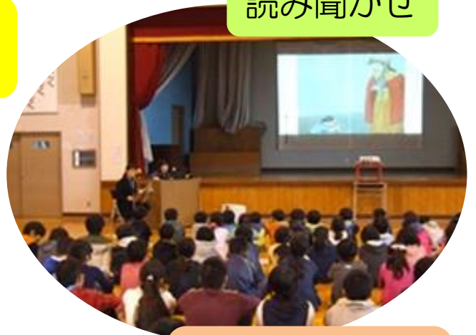
プロの小説家による講話