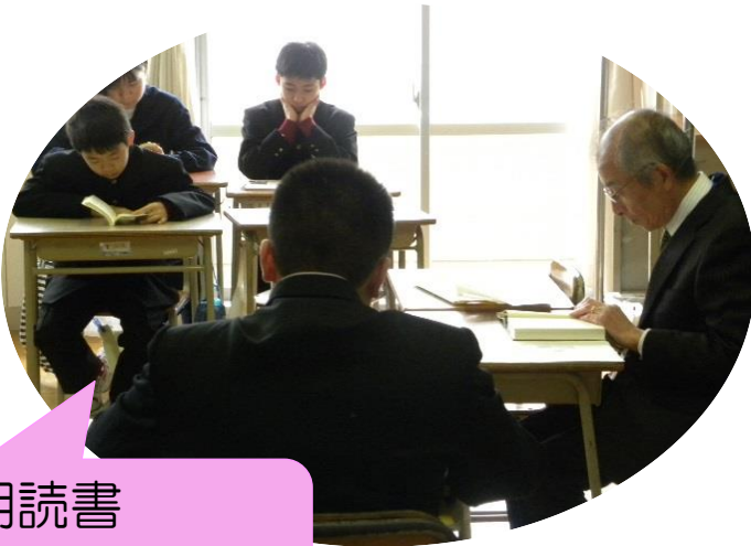
朝読書 ボランティア