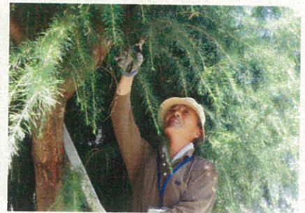
生い茂った松の木の剪定は大変です！