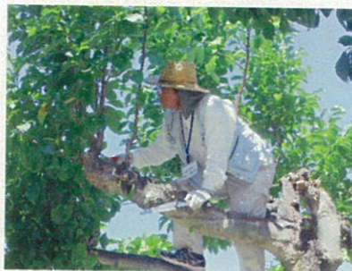
高い木だつて登ります←