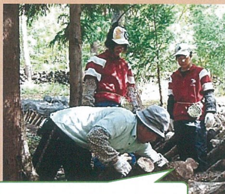
前川さんではホダ木を並べました。