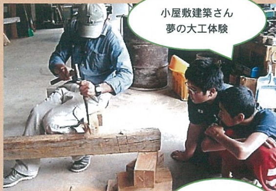
小屋敷建築さん 夢の大工体験