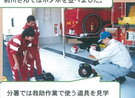
分署では救助作業で使う道具を見学

—お世話になった事業所紹介— まさや牧場、上神田精肉店、ナガサワ自工、前川しいたけ園、小屋敷建築、ハックの家、マルコシ商店、給食センター、普代村図書館、普代分署、はまゆり子ども園、普代村役場、うねとり荘、大上食堂、魚定、下川原商店、野口園芸、くろさき荘 …以上18カ所（敬称略順不同）