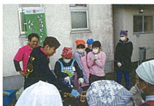
順番に 全員が 体験