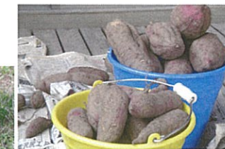
大きな 大きな さつまいも