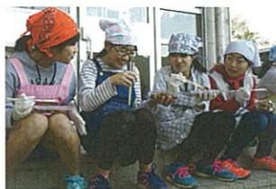
おいしい 試食タイム